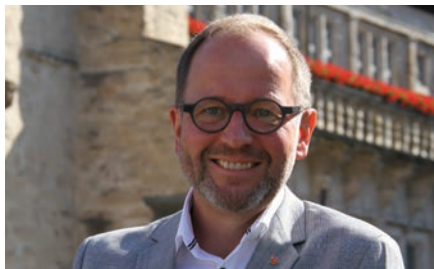
Ihr Verbandsvorsteher Landesverband Lippe

Freuen Sie sich mit uns auf ein ganz besonderes Jubiläumsjahr, zu Füßen Ihres Hermannsdenkmals.