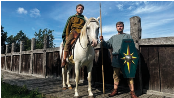
Cheruskische Reiterei.

Veranstalter: Archäologisches Freilichtmuseum Oerlinghausen